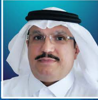
سعادة الأستاذ عبد العزيز بن حمد العقيل الأمين العام المملكة العربية السعودية