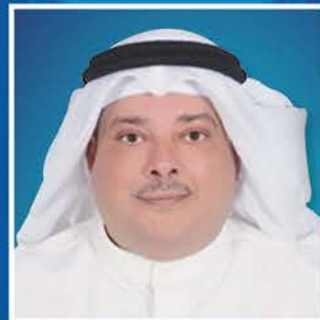
سعادة الأستاذ شمالان بن حمود الجحيدلي الأمين العام المساعد لقطاع المعلومات الصناعية والدراسات دولة الكويت