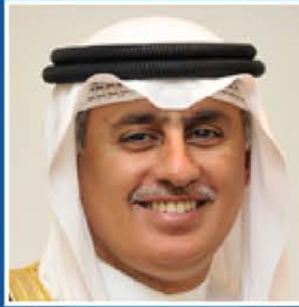
سعادة الأستاذ زايد بن راشد الزياني وزير الصناعة والتجارة والسياحة مملكة البحرين