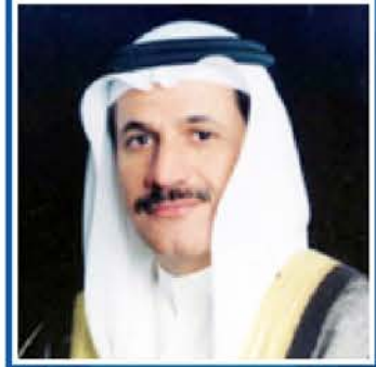
معالي المهندس سلطان بن سعيد المتصوري وزير الاقتصاد دولة الإمارات العربية المتحدة