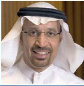
معالي المهندس خالد بن عبد العزيز الفالح وزير الطاقة والصناعة والثروة المعدنية المملكة العربية السعودية