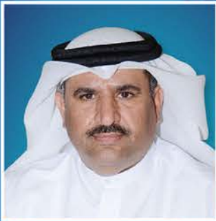
سعادة الدكتور علي حامد الملا الأمين العام المساعد لقطاع المشروعات الصناعية دولة قطر