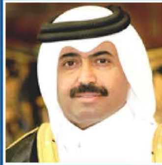
سعادة الدكتور محمد بن صالح السادة وزير الطاقة والصناعة دولة قطر