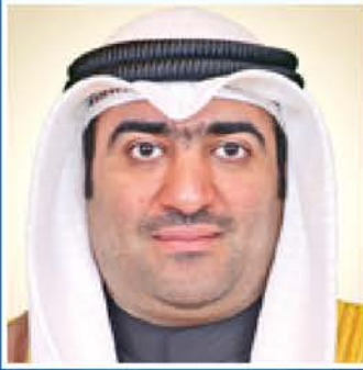
معالي الأستاذ خالد ناصر الروضان وزير التجارة والصناعة دولة الكويت