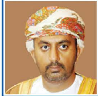
معالي الدكتور علي بن مسعود السندي وزير التجارة والصناعة سلطنة عمان